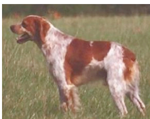
Figure B : Épagneul breton anoure

La même mutation a été retrouvée chez l'Épagneul breton pour l'expression de ce phénotype. Un individu anoure comme dans la figure B ou brachyoure comme dans la figure C présentent un génotype C//G et sont donc hétérozygotes pour ce gène, alors qu'un individu machyoure est homozygote C//C concordant avec un phénotype « queue de longueur normale » .