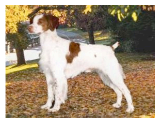
Figure C : Épagneul breton brachyoure